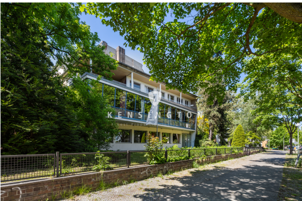
mögliches neues Gebäude mit Baugenehmigung