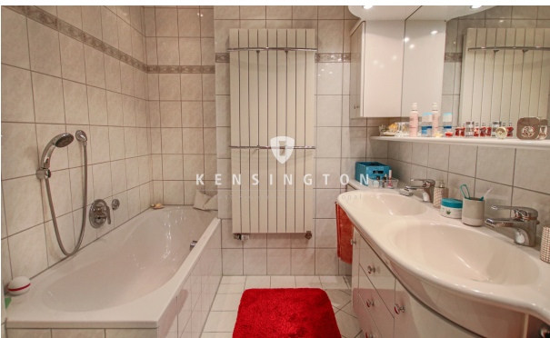
Badezimmer OG_KBR_172_Reihenmittelhaus in Seevetal