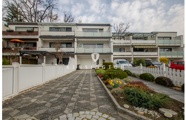
**Einfahrt_KBR_172_Reihenmittelhaus in Seevetal