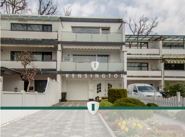
**Titelbild_2_KBR_172_Reihenmittelhaus in Seevetal