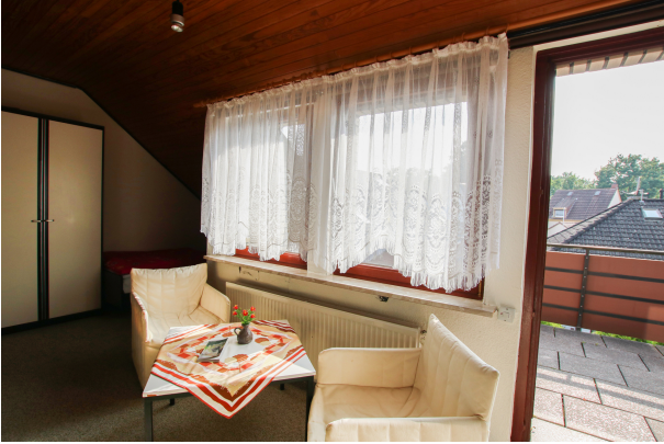
Zimmer 1 - OG