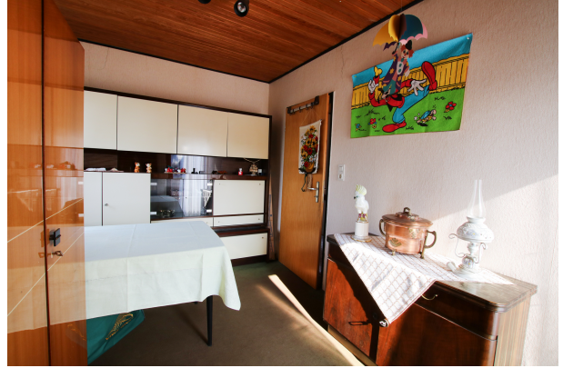
*Zimmer 2 - OG