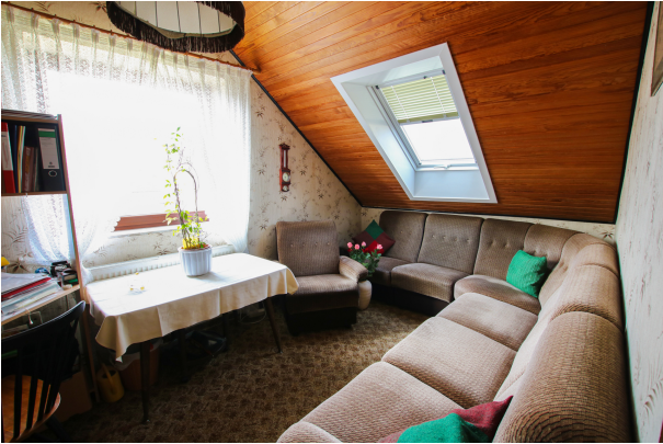
Zimmer 3 - OG