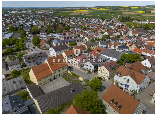
Mitten im schönen Kösching!