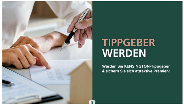
Werden Sie Tippgeber!

KENSINGTON FINEST PROPERTIES INTERNATIONAL