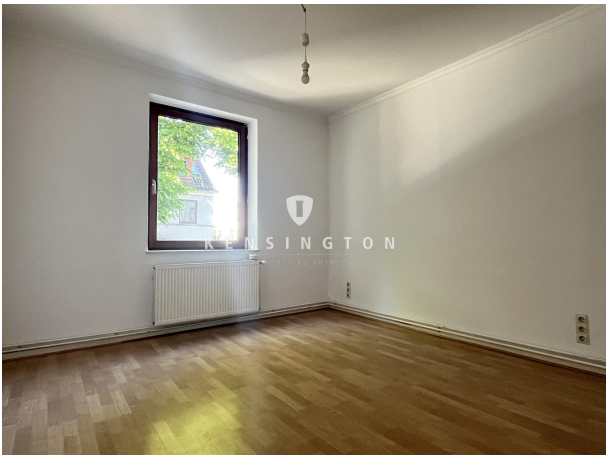
Zimmer 4 rechts_Wohnung. 1. OG