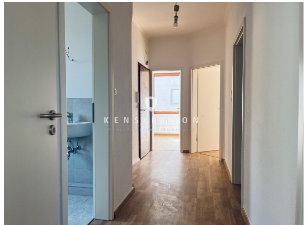
Flur_Wohnung. 1. OG