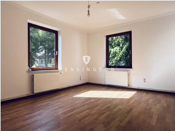
Zimmer 2 links_Wohnung. 1. OG