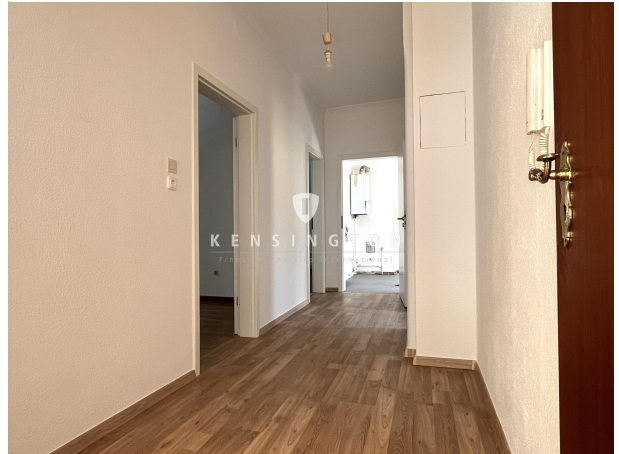
Flur_Wohnung. 1. OG