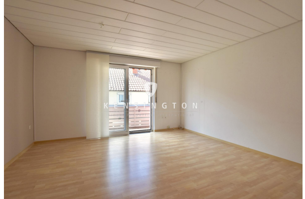
Wohnbereich mit angrenzendem West-Balkon