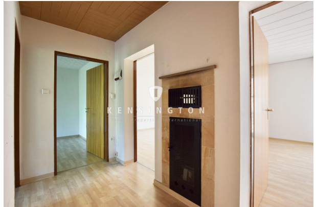
Eingangsbereich / Diele / Gas-Ofen