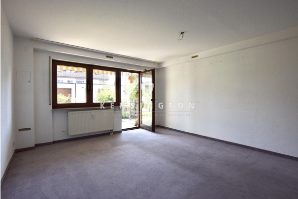
Hobbyraum/ Gästezimmer/ Büro