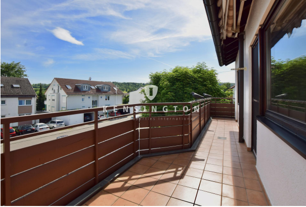
Balkon mit Südausrichtung