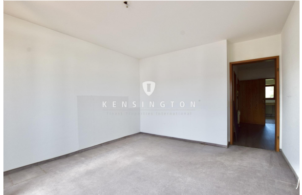
Schlafzimmer / Kinderzimmer