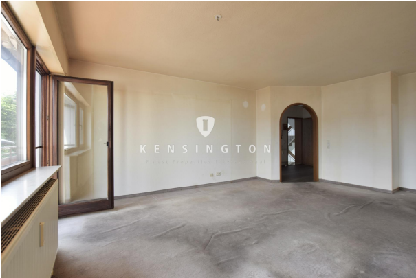
Wohnbereich mit Balkonzugang