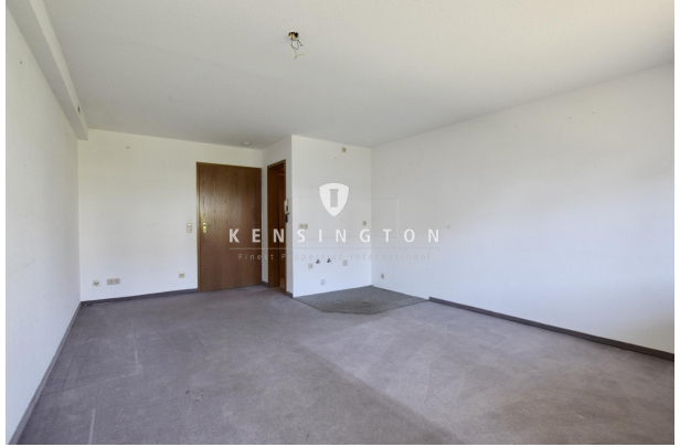
Platz für eine Kochnische