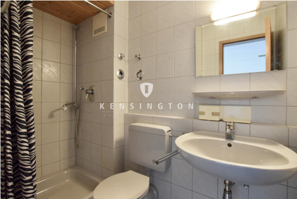
Duschbad im Hobbyraum